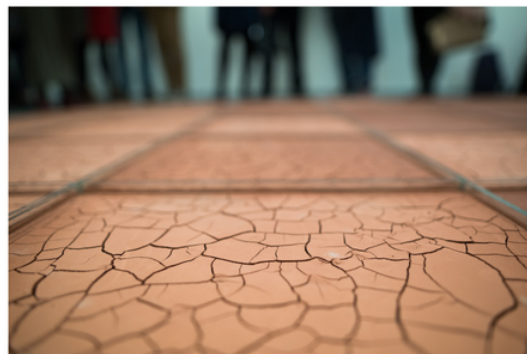
Robert Buček, Bez názvu , hlína, vosk, rákosí, 2021—2022, instalace, vpravo Janiszów , 300 × 300 × 3 cm