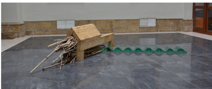
Robert Buček, A River Is My Favourite Neighbour , 2019—2020, instalace, dřevo, sklo, naplavené dříví, 200 × 450 × 95 cm