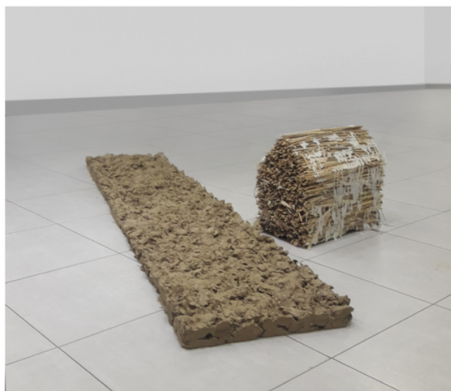
Robert Buček, Krajobraz 1 — Kanal , 2017—2018, kámen; vpravo Suché léto , 2018, hlína, vosk, rákosí