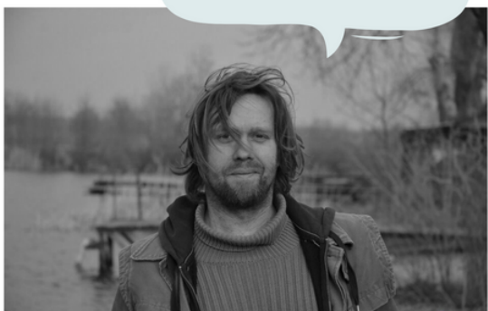
Sochař Robert Buček